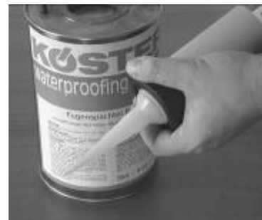
3. Sosis tabancasının ucunu monte ediniz.