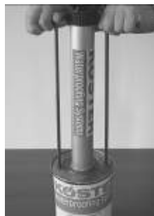
2. Hazırlanan karışımı adaptör yardımı ile doldurunuz.