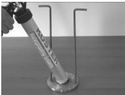
1. Sosis tabancasının ucunu sökerek adaptöre monte ediniz.