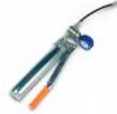
KÖSTER Manuel Enjeksiyon Presi

Uygulama sırasında katı veya sıvı madde tüketmeyiniz, buharını teneffüs etmeyiniz. Koruyucu eldiven, gözlük ve elbise kullanınız. Göz ve deri temasından kaçınınız. Deri teması halinde bol su ve sabun ile yıkayınız. Göz teması halinde bol su ile yıkayınız ve hemen bir doktora başvurunuz. Çocukların ulaşamayacağı yerde saklayınız. Yutmayınız, boş ambalajları gıda maddesi ve içme suyu depolamak amacı ile kullanmayınız.